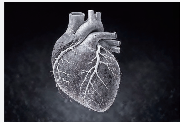
影像為檢查示意,非本院實際病例。